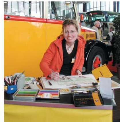
Einladungen von Veranstaltern und Unternehmern aus dem Umfeld der Mobilität folgt die mobile Künstlerin oft und gerne. Den temporären Reiz bringt sie mit flotter Feder zu Papier.